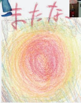
オリジナル絵本と朗読