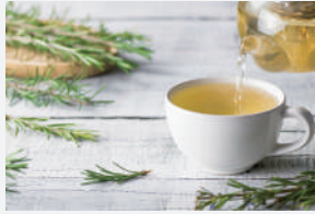
ハーブティを飲みながら 作品をご覧ください。